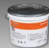
fermacell Powerpanel Afwerkmortel (pasteus) # 79090