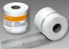
fermacell Powerpanel HD Wapeningsband # 79050