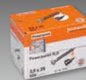
fermacell Powerpanel H 2 O Schroeven # 79120