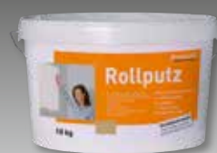
fermacell Rolpleister # 79168