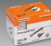
fermacell Powerpanel H 2 O Schroeven # 79120